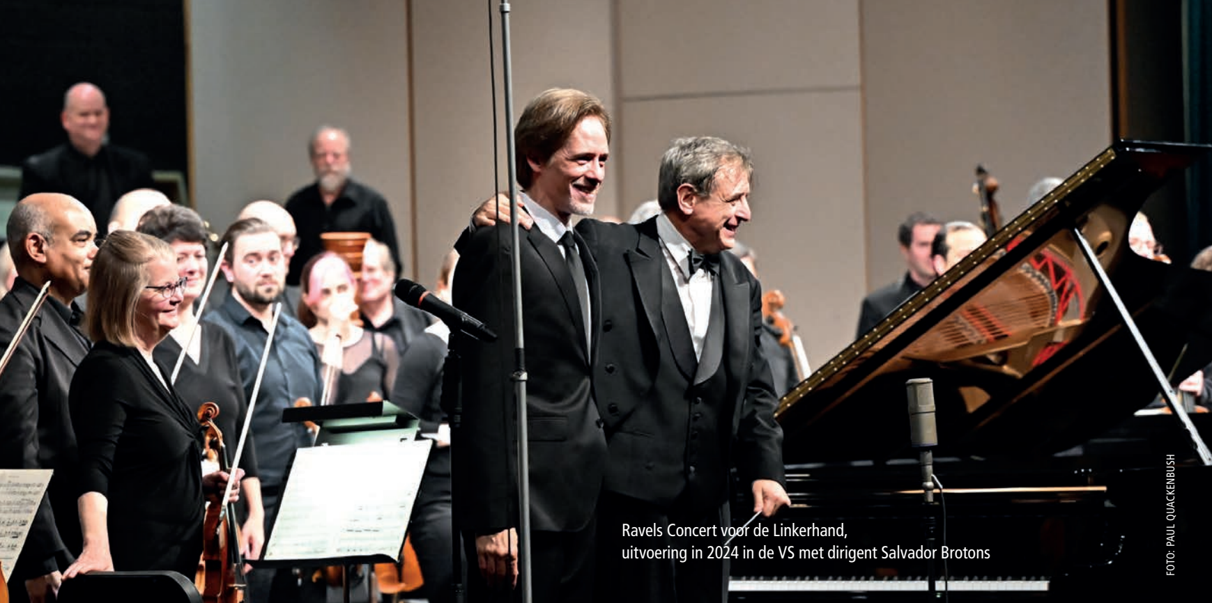
Ravels Concert voor de Linkerhand, uitvoering in 2024 in de VS met dirigent Salvador Brotons